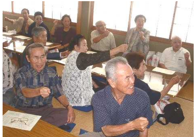
ジャンケンで頭の体操も「パーに負ける手を出してください」