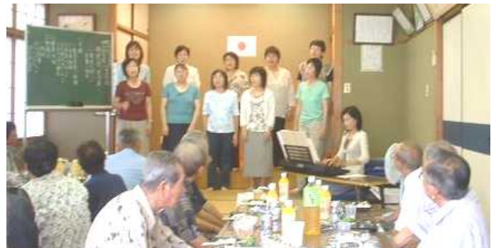
合唱の美声とハーモニーに引き込まれ、一緒に歌いました