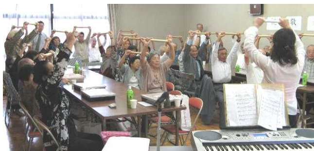
「音楽療法」で心身とも爽快！ナツメロを堪能しました

当日、心配していた台風もそれてくれ、大役の一つを終えて、しばしホッとしているところです。□■