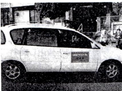
青色回転灯は毎週金曜周ります

こうした活動を支援するため、岐阜市では平成15年度から「みんなで作る“ホッとタウン”プロジェクト事業を展開しています。今回は、その中の「青色回転灯支給事業」によるもので、中署管内では2番目という早い取り組みです。また、「地域安全運動支援事業」で、ベストや帽子をお配りしますので、防犯ボランティア活動にご活用ください。