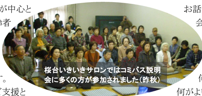
桜台いきいきサロンではコミバス説明会に多くの方が参加されました(昨秋)