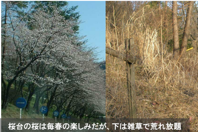
桜台の桜は毎春の楽しみだが、下は雑草で荒れ放題

無理なことをするのではなく、お互いできることをして一日汗を流して親交を深めることができれば、町の活性化のアイデアも生まれるのではないのでしょうか。