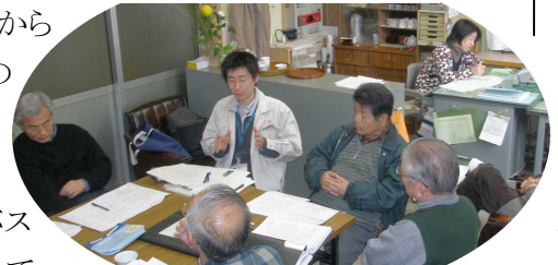
コミバス計画チームはボランティア、行政、芥見南の方も交えて準備に余念がありません

私たちのこれから の生活の向上の ために、大勢の 方の努力・協力 でコミュニティバス が発車しようとして います。