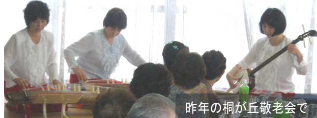
昨年の桐が丘敬老会で