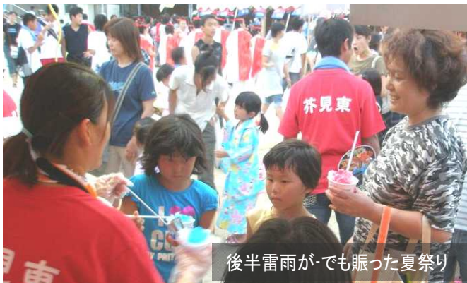
後半雷雨が-でも賑った夏祭り

大声競争や三角巾リレー、玉入れなど防災も取り入れた、高齢者は走らずに楽しめるスタイルに変身。皆さん、お気軽に出場者名簿に登録してください。