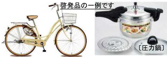
啓発品の一例です