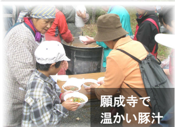
願成寺で 温かい豚汁

火災シースンです。コンロの不始末が住宅火災のワーストワン。特に一人住まいの方は、コンロ使用中に電話や来客が↓↓まず火元OFF。タイマーベルも消し忘れに効きます