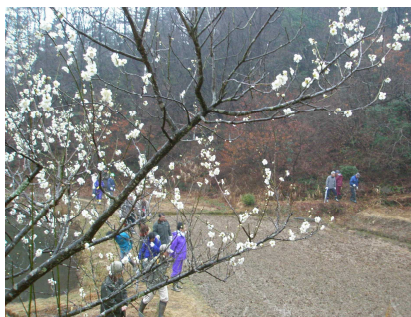
大洞・硯石池の白梅は満開です

関係団体各位における「きっといい街」「いい出会い」を目指す、地域づくり活動への日々のご尽力に感謝しています。 □■