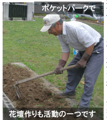
花壇作りも活動の一つです

お礼 本紙は月刊化して35号、今年度も多くの皆さまから記事や原稿を、そしてご愛読をいただきありがとうございました。編集部一同