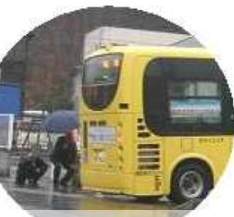
北山⇒三心の右折可否試験

2 路線バスで利用されているアユカやおでかけカードが3月15日から市内のコミバスでも使えるようになります。もちろん現行の回数券や現金も使えます。