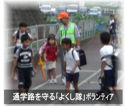
通学路を守る「よくし隊」ボランティア

みどりっこバスでヘルパーする人、通学路に立つ人、公道の清掃・草引きなど、活動単位も個人やグループなど、この地域の