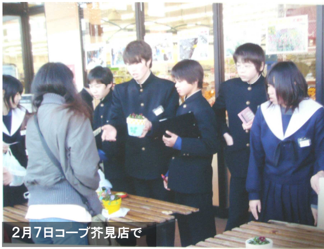
2月7日コープ芥見店で