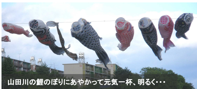
山田川の鯉のぼりにあやかっって元気一杯、明るく・・・

日々、未曾有の大不況の暗いニュースが報じられていますが、私自身、健康第一(心配は病気の前、笑顔は健康の前)で、一日一日を明るく楽しく生活して行きたいものです。どうぞよろしくお願いいたします。 □■