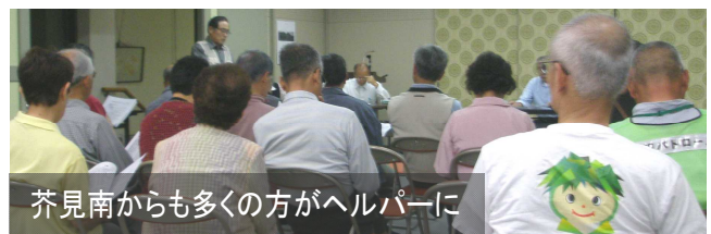
芥見南からも多くの方がヘルパーに

ボランティア協会では、先ほど総会を開き、みどりっこバスヘルパー(車掌さん役)の課題や当番日などを協議しました。