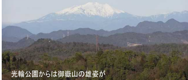
光輪公園からは御嶽山の雄姿が

今、仕事をさせてもらっている光輪公園の頂上からは、北東に御嶽山、乗鞍が、北西は能郷白山、西は伊吹山が見渡され、絶景そのもの。山と緑に心も洗われて、小さなことにくよくよせず、ゆっくり生きよと教えられます。