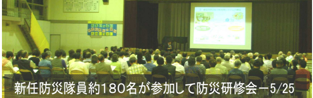
新任防災隊員約180名が参加して防災研修会—5/25