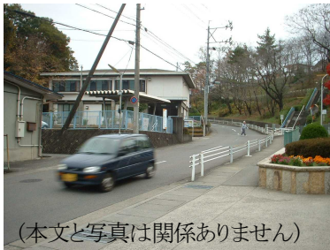
(本文と写真は関係ありません)

もう一件、小学校の前の下り坂です。皆さんかなりのスピードで下って来ます。この前も知り合いの人が事故にあっています。