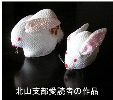
北山支部愛読者の作品

結婚をし、岐阜へ嫁いで3年目。右も左もわからない土地での生活に苦労しつつも慣れてきた今年に、支部長という仕事を任せられました。出産を控え初めは断りたい気持ちでいっぱいでした。