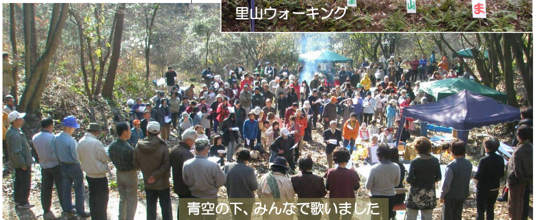
青空の下、みんなで歌いました