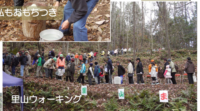
里山ウォーキング