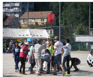
第35回市民運動会から