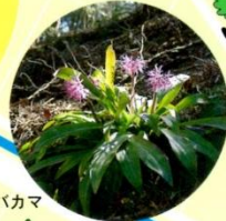
ショウジョウバカマ