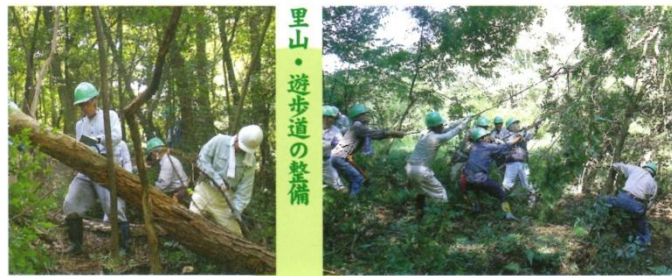
里山・遊歩道の整備

私たちはこの想いを胸に「大洞すずろしの里」を拠点に、次の活動に取り組んでいます。