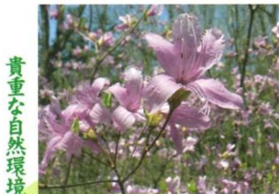
貴重な自然環境の保全