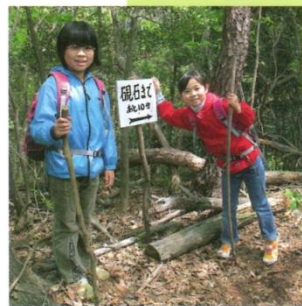
子どもたちの自然体験推進