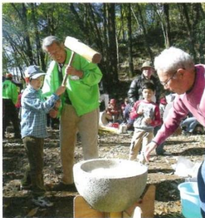
地域交流・世代間交流の推進