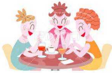
ptm.jp - 1749799

住民の高齢化は桜台も例外ではない。独居の人も増えてきた。生き甲斐となる趣味を持つ人はいい。ひたすら家族のために働き、子は巣立ち気が付いたら、一人取り残されて話す相手もない。「ことばを忘れそうになるで、テレビとしゃべるとるんやよ」以前、ひとり暮らしの老母のこぼした言葉を思い出す。なんと淋しいことか。