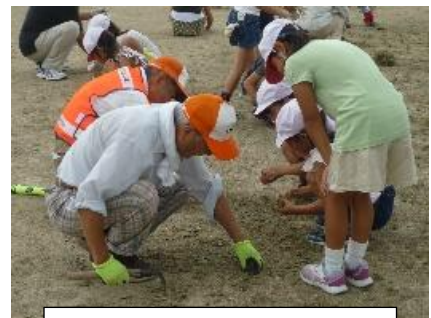
昨年の草ぬき活動の様子

9月4日(火)~7日(金)まで芥見東小学校の運動場で草ぬき活動があります。運動会(22日)をひかえ、運動場を小学生と一緒にきれいにしたいと思います。時間は、7時50分頃から8時20分頃までです。その後、小学校の「地域ルーム(仮称)」で休んでいただいたり、運動会練習に取り組む小学生の姿をご覧いただけます。どうぞ、お誘いあわせのうえ、ご参加ください。 □■