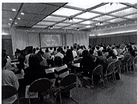
消防研修会の様子

る電気火災について知識を深めることができました。また、消防本部からの資料提供を受け、「住宅火災危険予知トレーニング」をクラブ内で実施するなど、本来のクラブ活動を取り戻しつつあると感じています。今後も地域の防火・防災のためにクラブ員一丸となって活動していきたいと思えます。