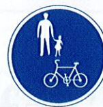
「普通自転車等及び歩行者等専用」